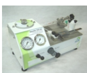
Aparelho de Permeabilidade