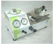
Aparelho de Permeabilidade